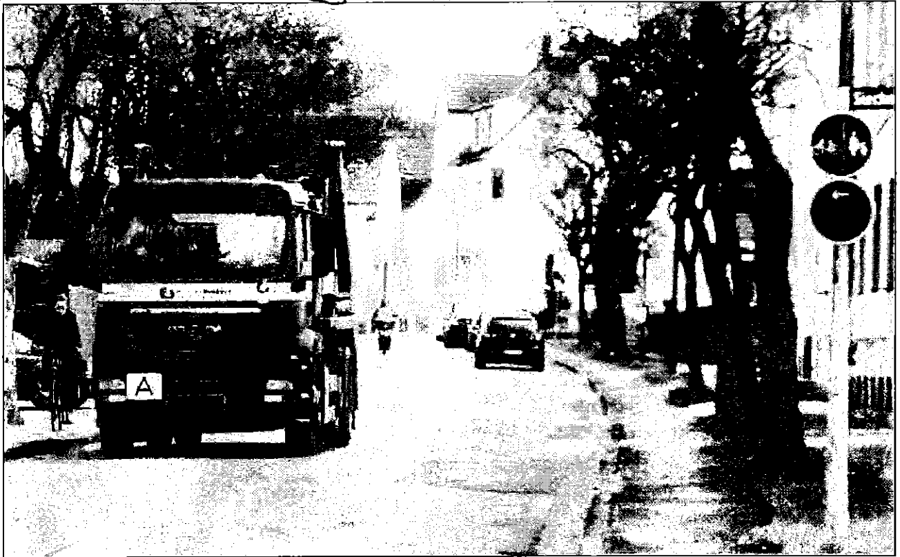
Zu laut und zu schnell: An der Westernkötter Straße habe der Lkw-Verkehr zugenommen, beobachtet Achim Sigge.