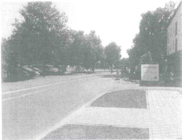
Blick in Ostrichtung