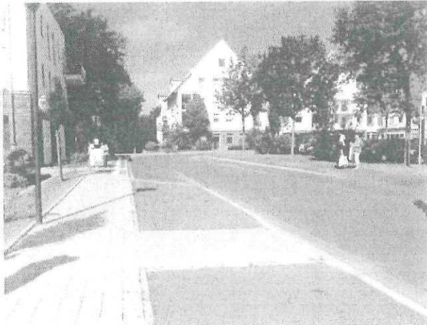
Blick in Westrichtung